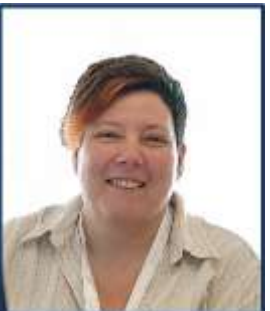
Tina Purnat (Depto. Preparação e Prevenção de epidemias e Pandemias – OMS)